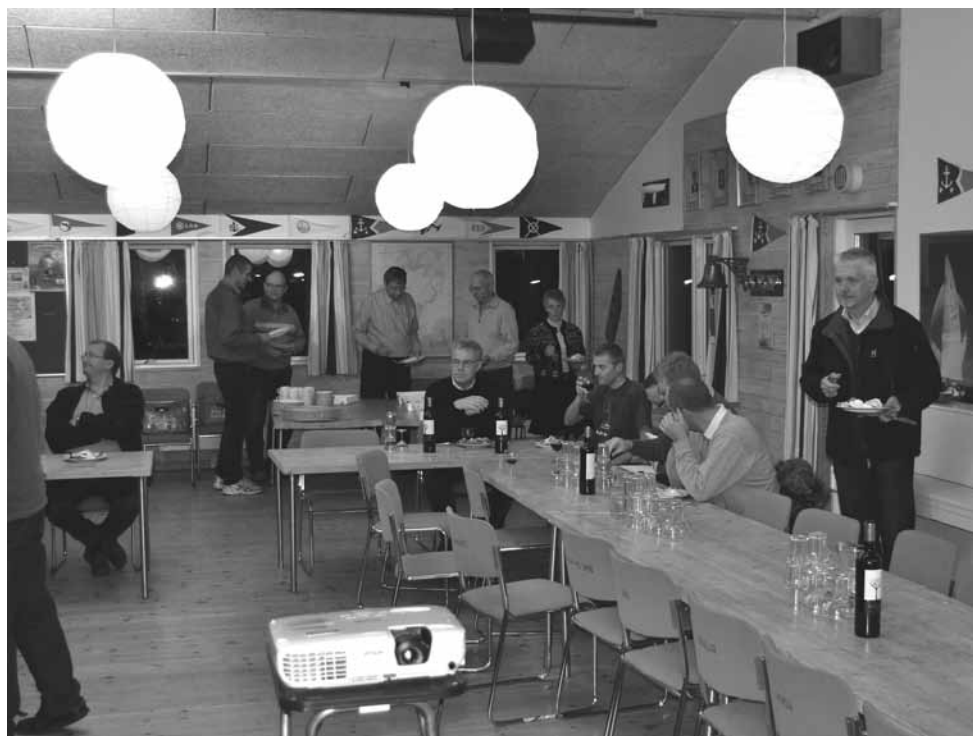
Afdelingsmøde i klubhuset